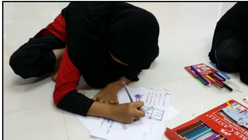
Caption : Mengambil bahagian dalam melukis poster sempena sambutan ITU Anniversary

iii) Lain-lain (contoh : proses penghasilan produk, penglibatan dalam aktiviti lain, dsb)