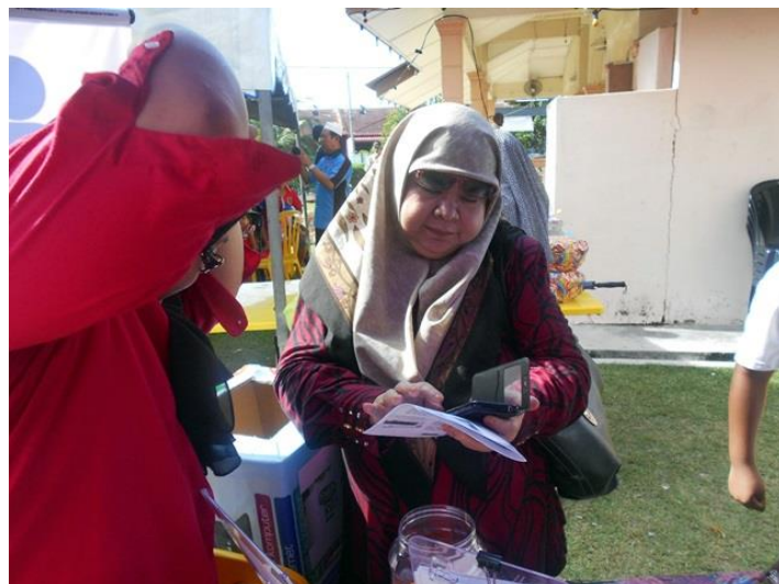
Sesi Pendaftaran Pengunjung Program