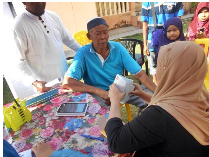
Pengunjung mencuba aplikasi My Health – memeriksa tekanan darah