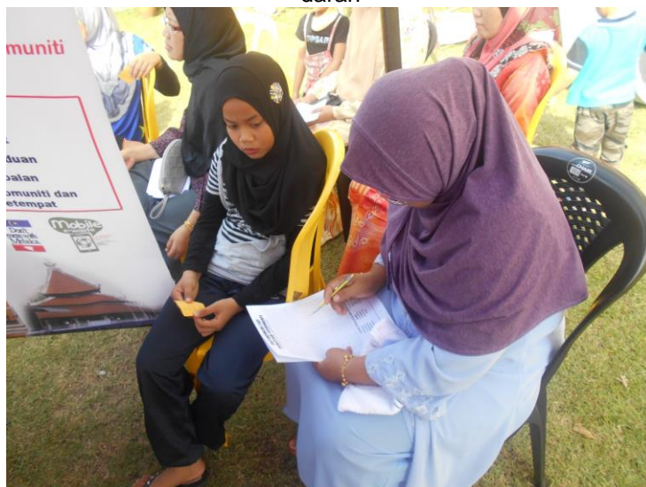
Pengunjung menyertai dan menjawab kuiz bertulis berkaitan dashboard