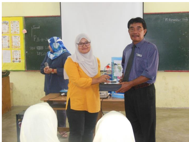
Penyampaian Cenderahati kepada Guru Besar SK Lubok Redan