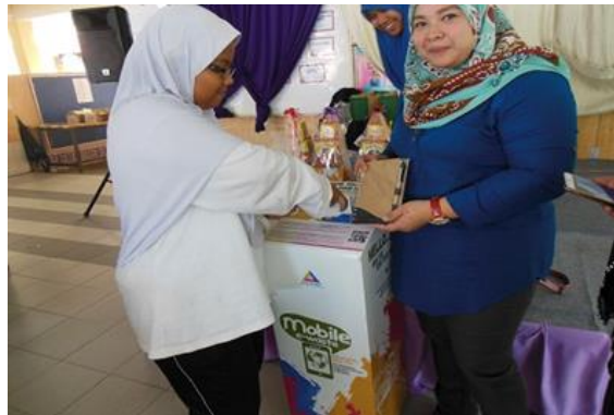
Cenderahati kepada penyumbang E-Waste