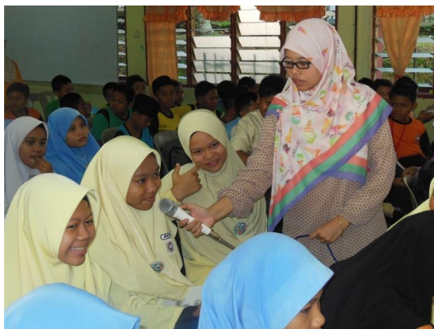
Sesi Soal Jawab antara pelajar dan petugas