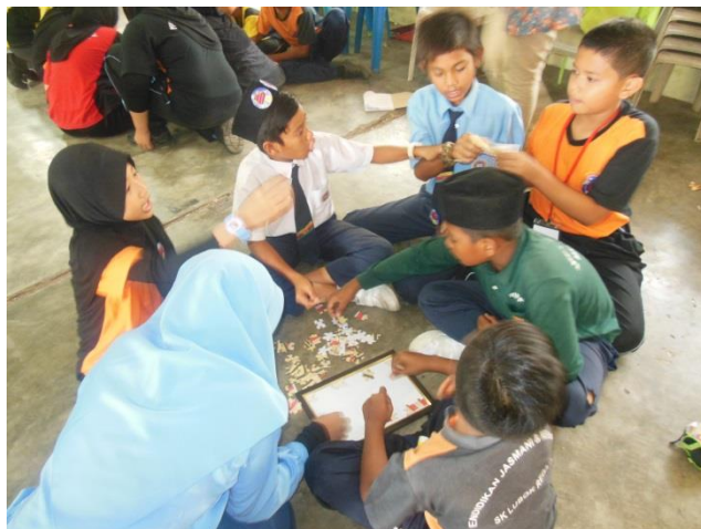
Sesi Menyelesaikan susunan puzzle KDB