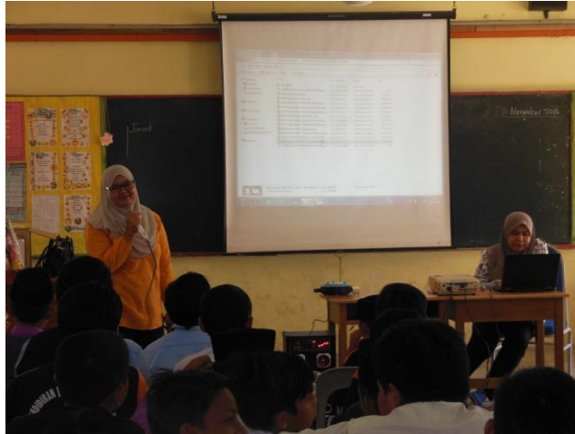
Taklimat dan Penerangan KDB