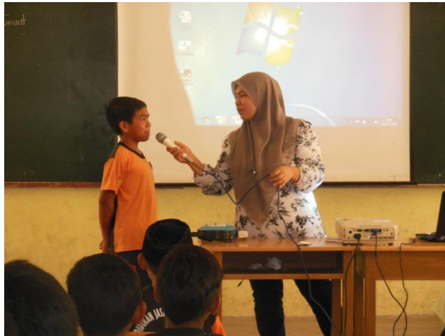
Sesi Soal Jawab