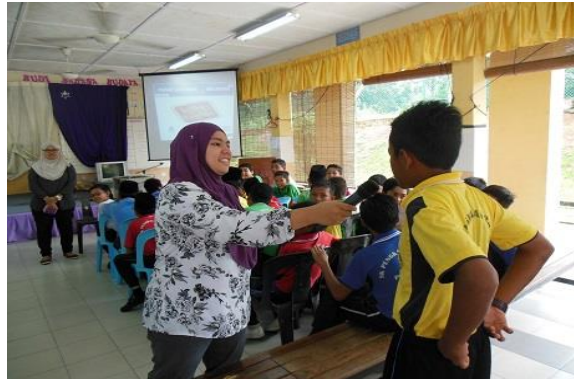
Sesi Soal Jawab