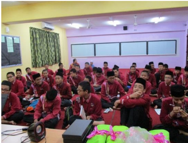
Pelajar SM Imtiaz mendengar taklimat yang diberikan