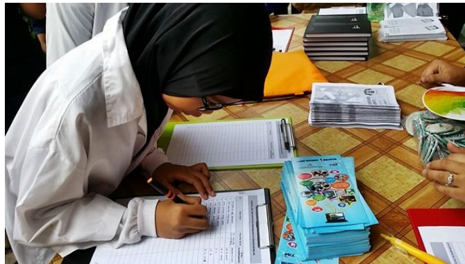
Pendaftaran Pengunjung Booth PI1M