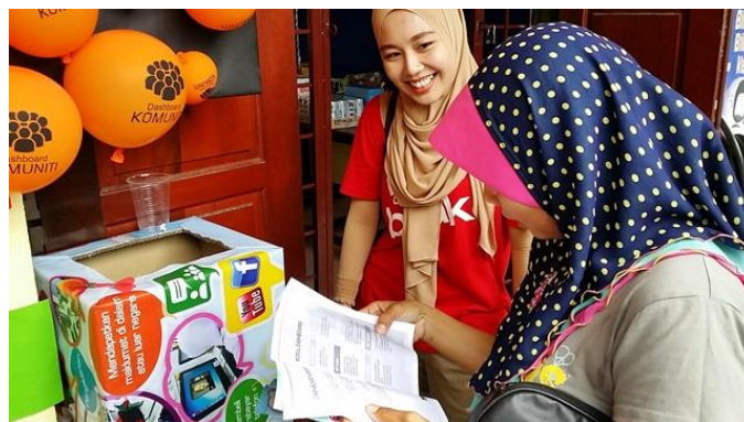
Penyertaan Games Dashboard Komuniti