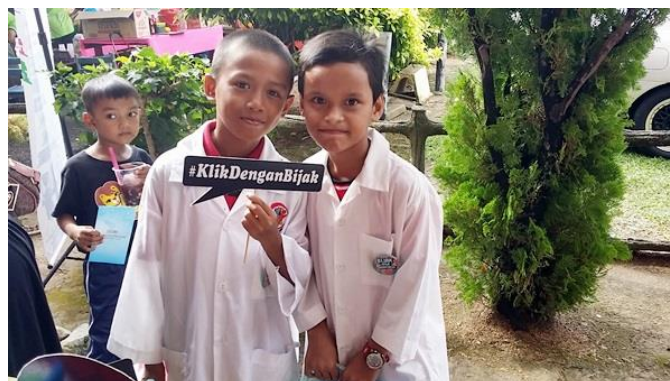
Cenderahati Hadiah KDB