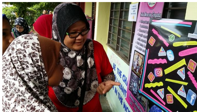
Penyertaan Kuiz KDB